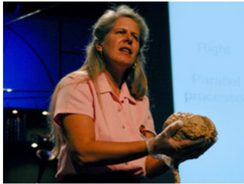
Simon Sinek: How great leaders inspire action