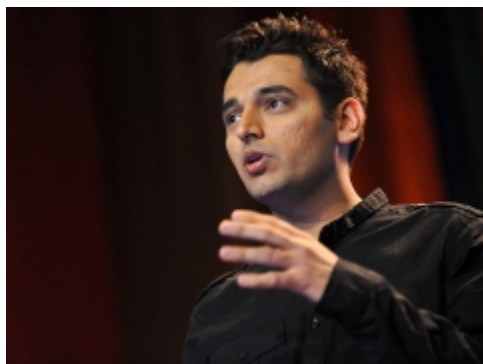
Brené Brown: The power of vulnerability