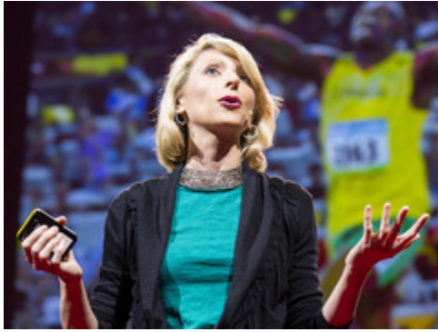
Dan Pink: The puzzle of motivation