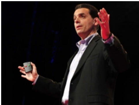
Hans Rosling: Stats that reshape your worldview