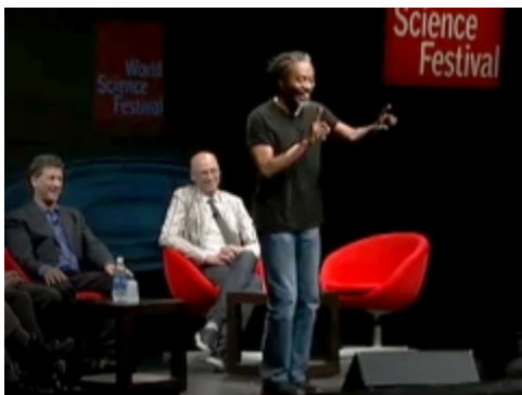
Amy Cuddy: Your body language shapes who you are